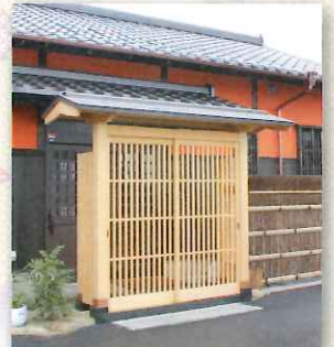
本店裏手“京の花れ屋”