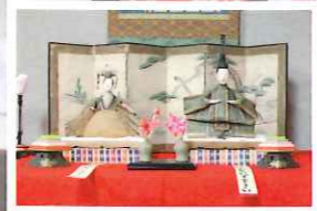
江戸中期 享保雛 (きょうほびな)