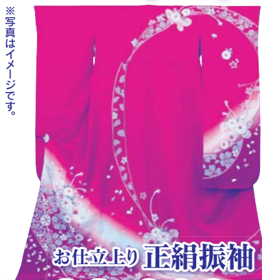
お仕立上り 正絹振袖