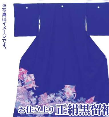
お仕立上り 正絹黒留袖