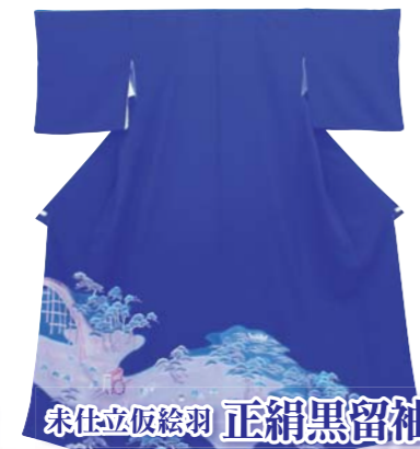
未仕立仮絵羽 正絹黒留袖