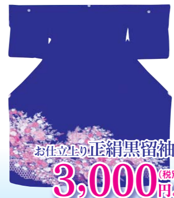
お仕立上り 正絹黒留袖 3,000 (税別) 円より