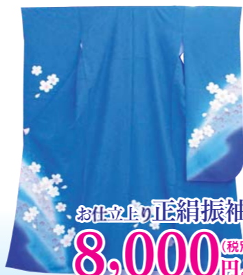
お仕立上り 正絹振袖 8,000 (税別) 円より