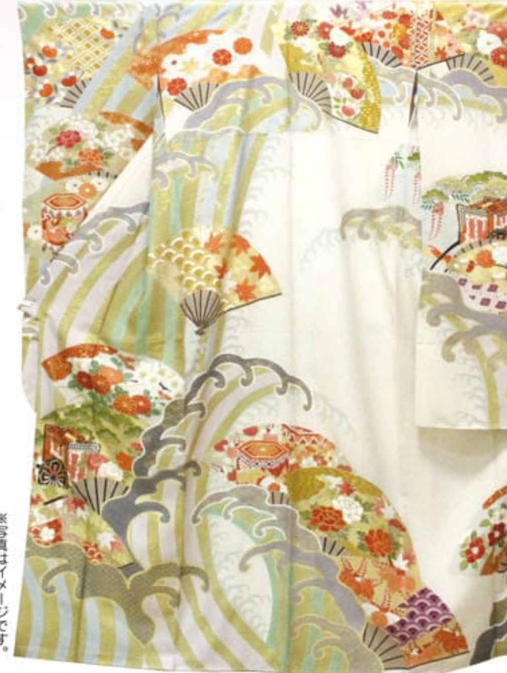
中古 千總製 お仕立上り 正絹振袖【扇面に波頭模様】 本体価格 280,000円 税込価格 302,400円