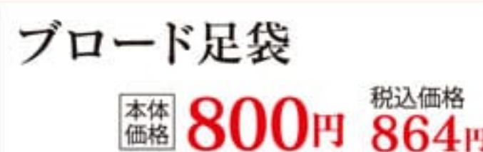
ブロード足袋 本体価格 800円 税込価格 864円