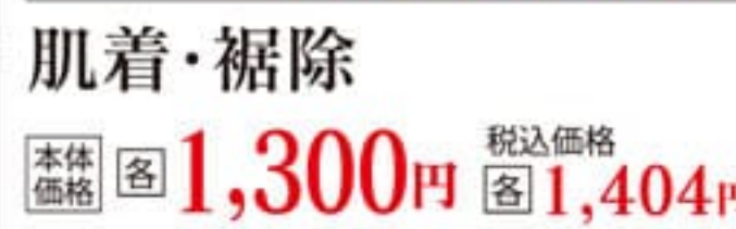
肌着・裾除 本体価格 各 1,300円 税込価格 各 1,404円