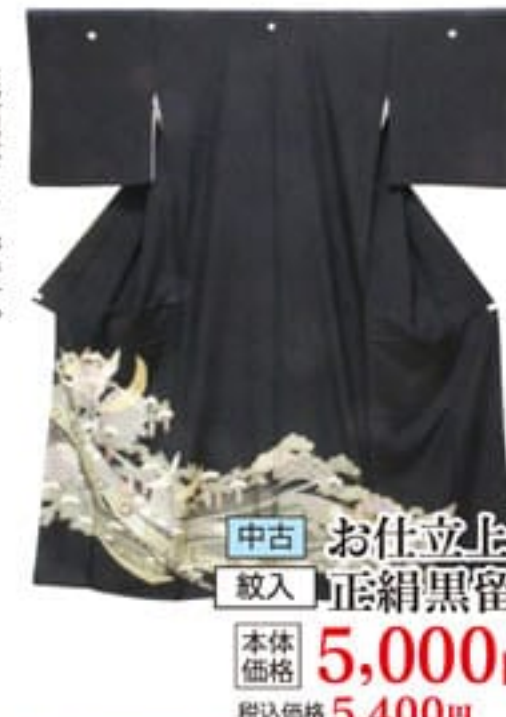
中古 お仕立上り 紋入 正絹黒留袖 本体価格 5,000円 税込価格 5,400円