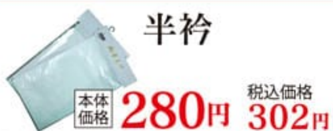
半衿 本体価格 280円 税込価格 302円