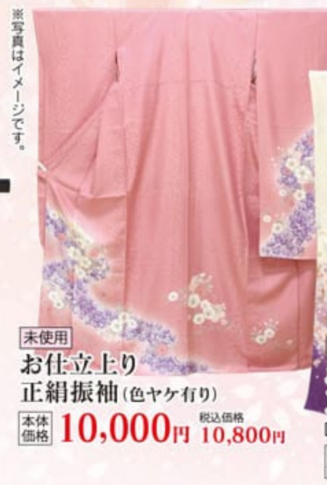
未使用 お仕立上り 正絹振袖(色ヤケ有り) 本体価格 10,000円 税込価格 10,800円