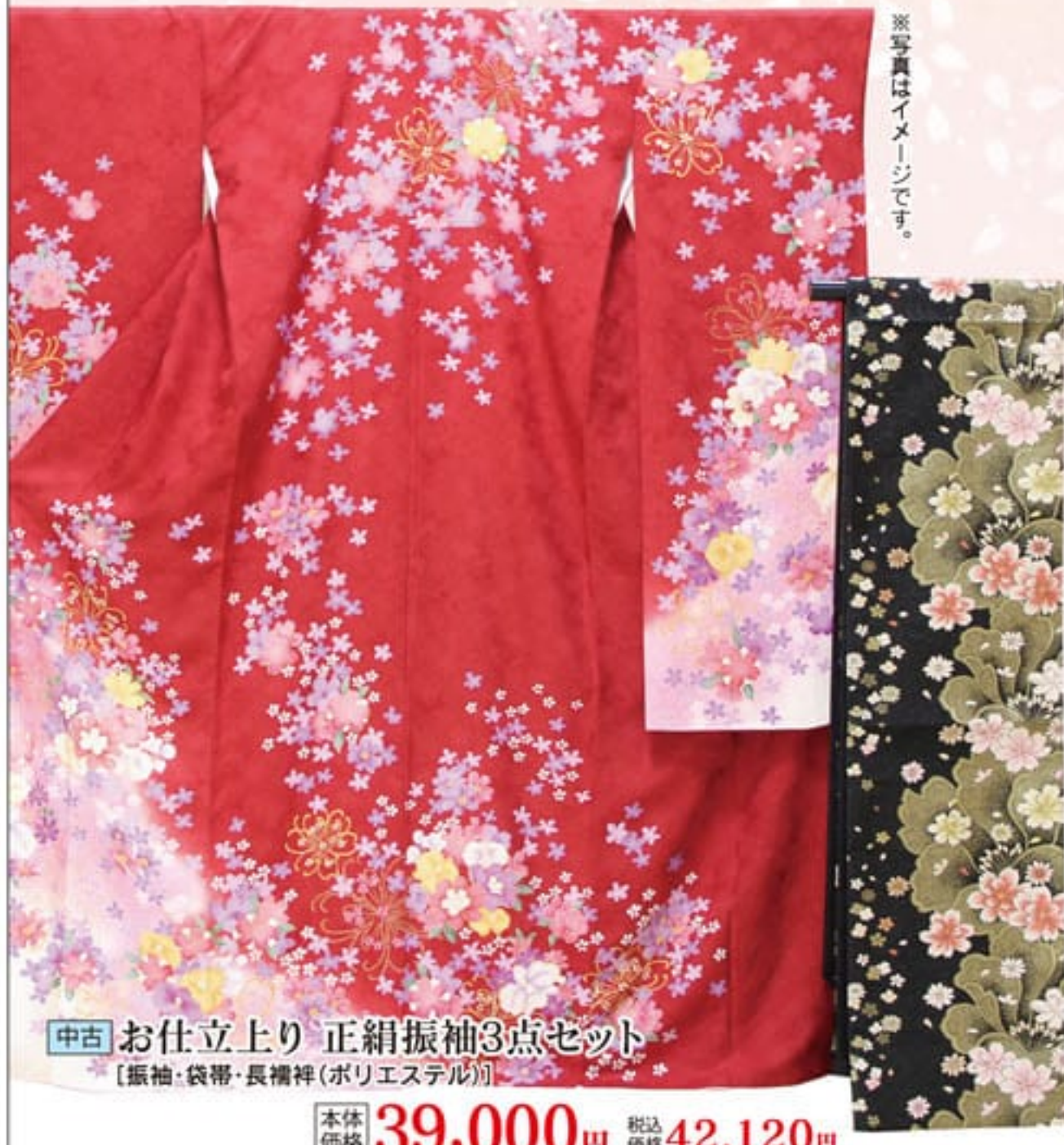
中古 お仕立上り 正絹振袖3点セット 【振袖・袋帯・長襦袢(ポリエステル)】 本体価格 39,000円 税込価格 42,120円