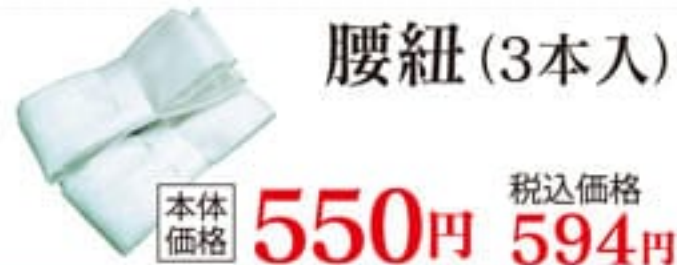
腰紐(3本入) 本体価格 550円 税込価格 594円