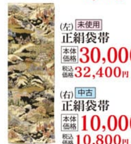
(左) 未使用 正絹袋帯 本体価格 30,000円 税込価格 32,400円