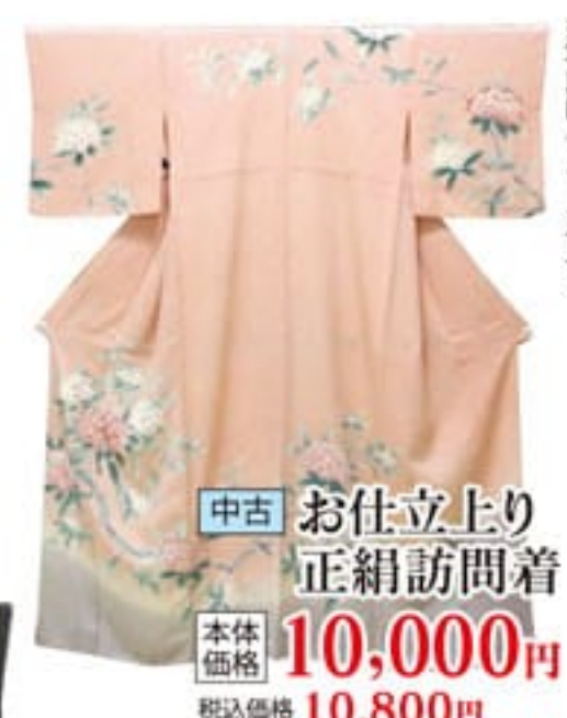
中古 お仕立上り 正絹訪問着 本体価格 10,000円 税込価格 10,800円