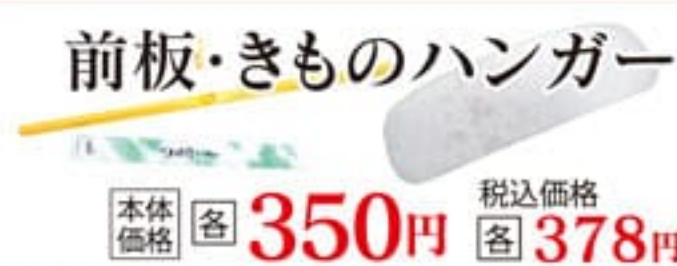
前板・きものハンガー 本体価格 各 350円 税込価格 各 378円