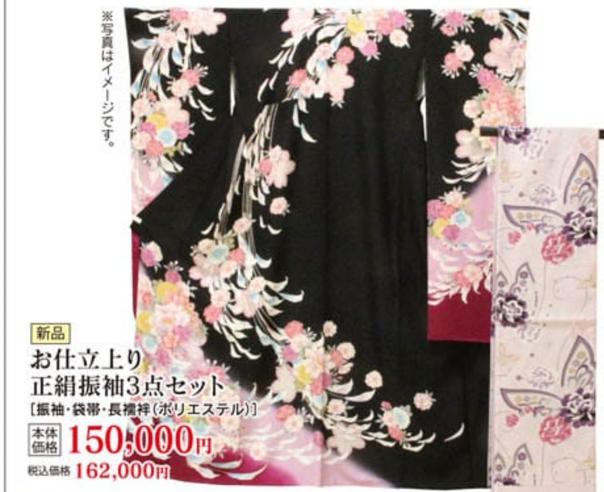
新品 お仕立上り 正絹振袖3点セット 【振袖・袋帯・長襦袢(ポリエステル)】 本体価格 150,000円 税込価格 162,000円