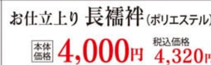
お仕立上り 長襦袢(ポリエステル) 本体価格 4,000円 税込価格 4,320円