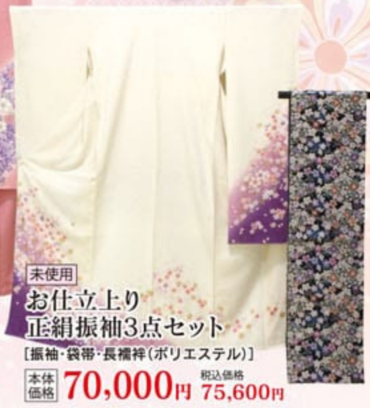
未使用 お仕立上り 正絹振袖3点セット 【振袖・袋帯・長襦袢(ポリエステル)】 本体価格 70,000円 税込価格 75,600円