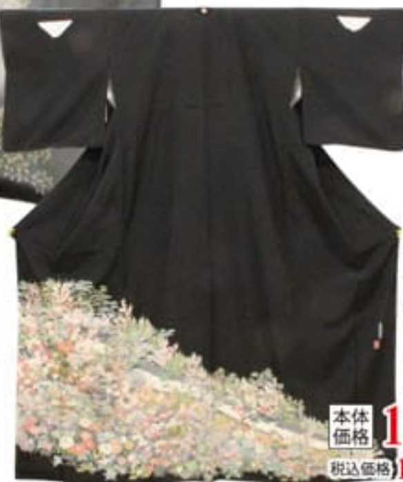
未使用 紋入 お仕立上り 正絹加賀友禅 黒留袖 本体価格 180,000円 税込価格 194,400円