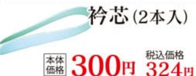
衿芯(2本入) 本体価格 300円 税込価格 324円