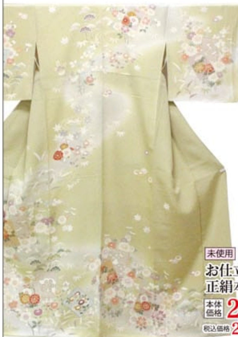
未使用 お仕立上り 正絹本加工訪問着 本体価格 250,000円 税込価格 270,000円