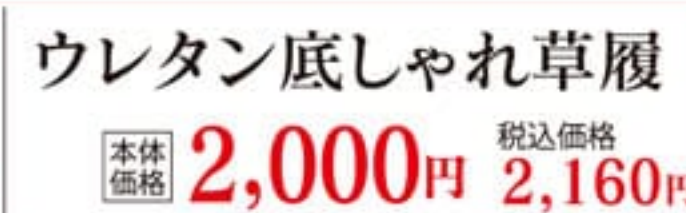
ウレタン底しゃれ草履 本体価格 2,000円 税込価格 2,160円