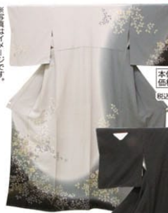
未使用 お仕立上り 正絹訪問着 本体価格 90,000円 税込価格 97,200円