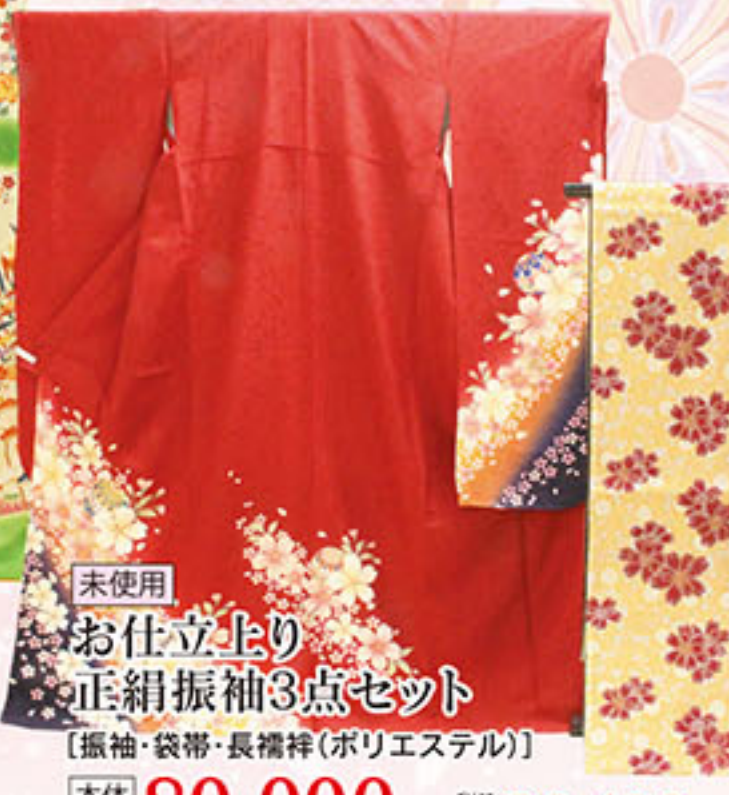
未使用 お仕立上り 正絹振袖3点セット [振袖・袋帯・長襦袢(ポリエステル)] 本体価格 80,000円 税込価格 86,400円