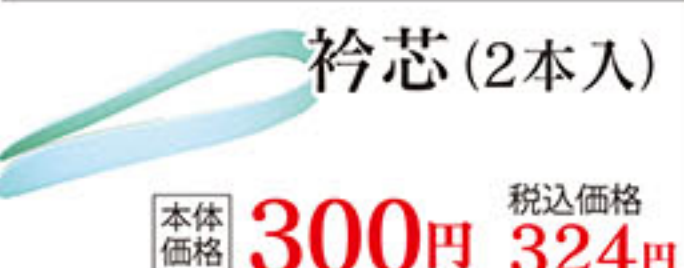
衿芯 (2本入) 本体価格 300円 税込価格 324円