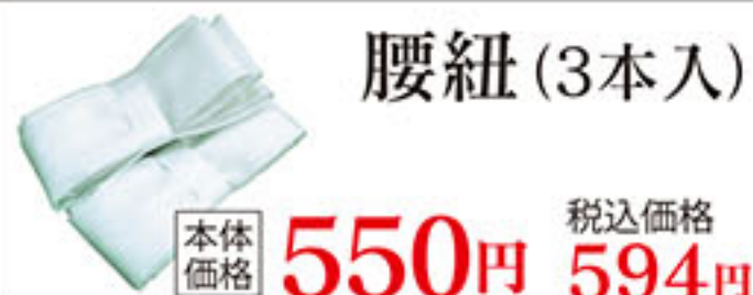
腰紐 (3本入) 本体価格 550円 税込価格 594円