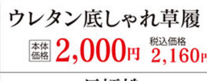
ウレタン底しゃれ草履 本体価格 2,000円 税込価格 2,160円