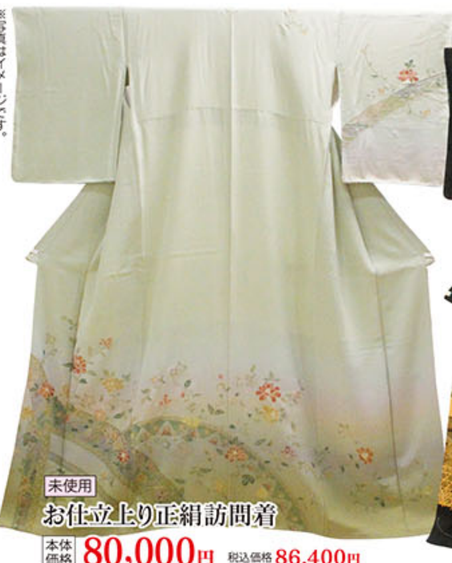
未使用 お仕立上り正絹訪問着 本体価格 80,000円 税込価格 86,400円