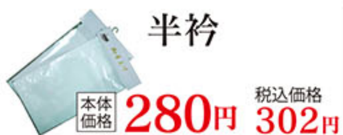
半衿 本体価格 280円 税込価格 302円