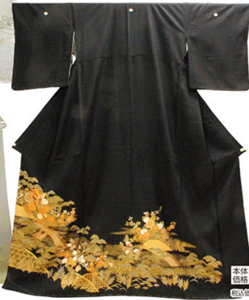
未使用 紋入 お仕立上り 正絹黒留袖 本体価格 29,000円 税込価格 31,320円