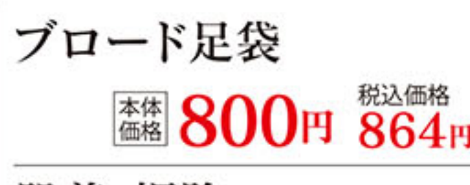
ブロード足袋 本体価格 800円 税込価格 864円