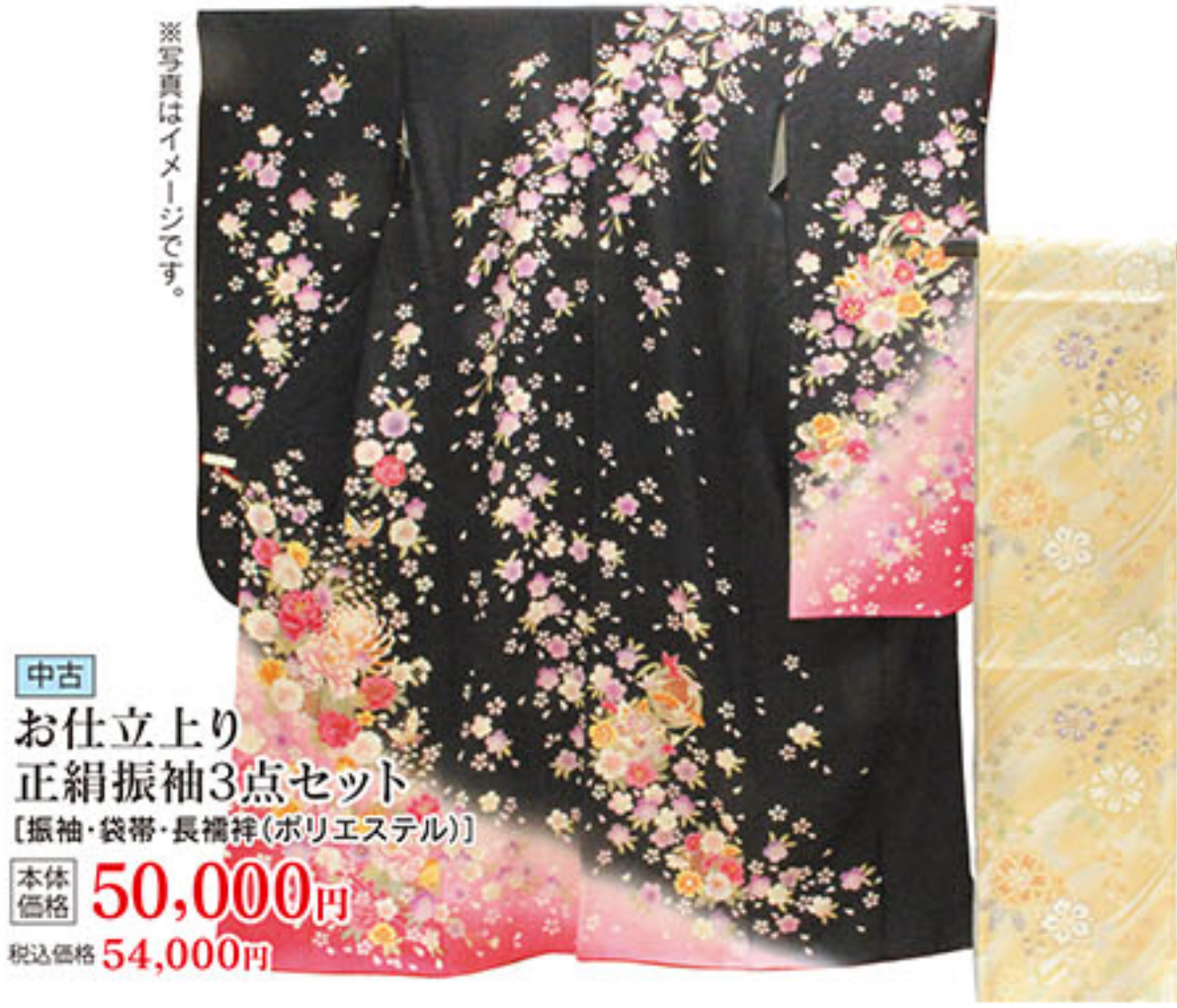
中古 お仕立上り 正絹振袖3点セット [振袖・袋帯・長襦袢(ポリエステル)] 本体価格 50,000円 税込価格 54,000円