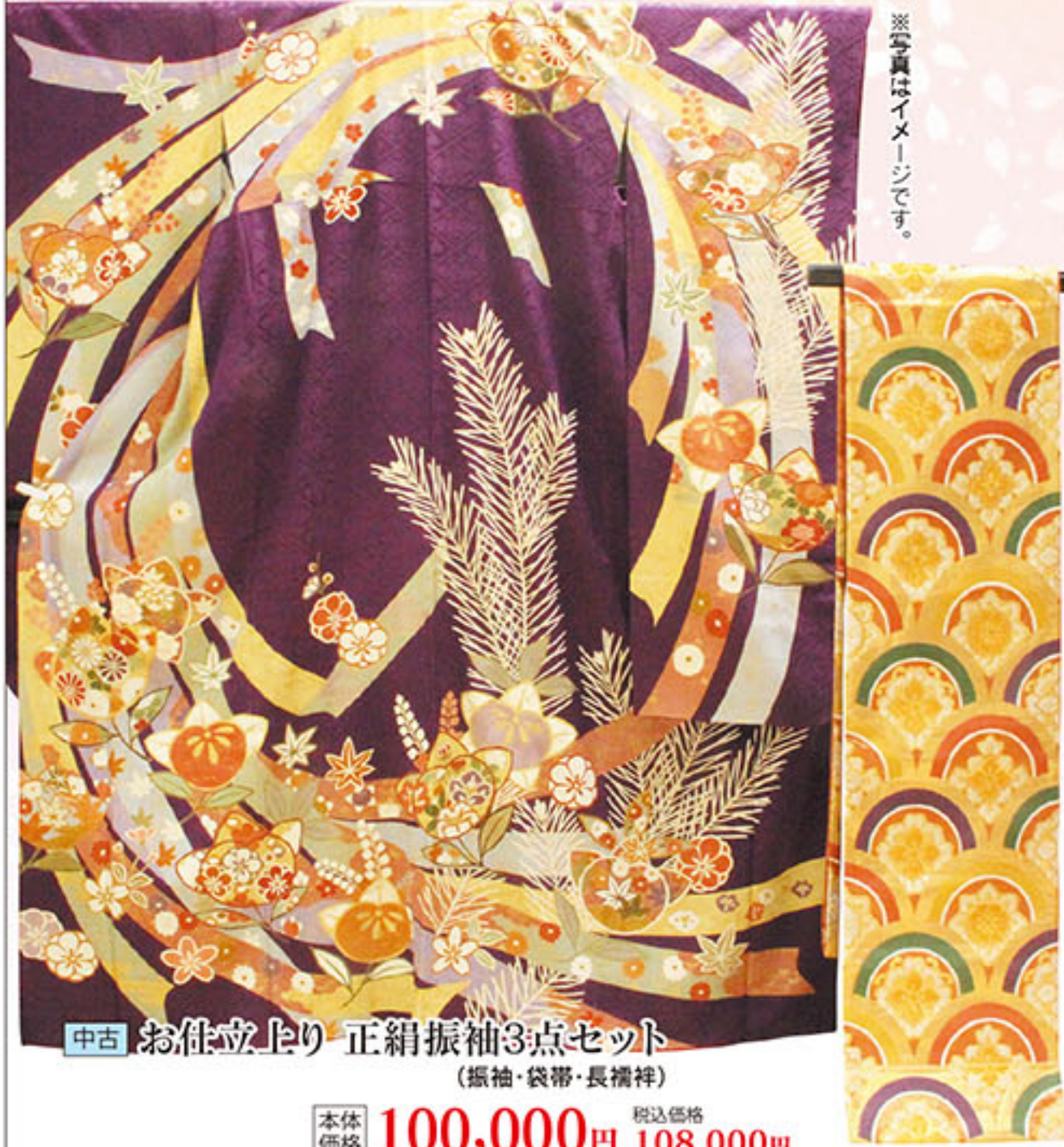
中古 お仕立上り 正絹振袖3点セット (振袖・袋帯・長襦袢) 本体価格 100,000円 税込価格 108,000円