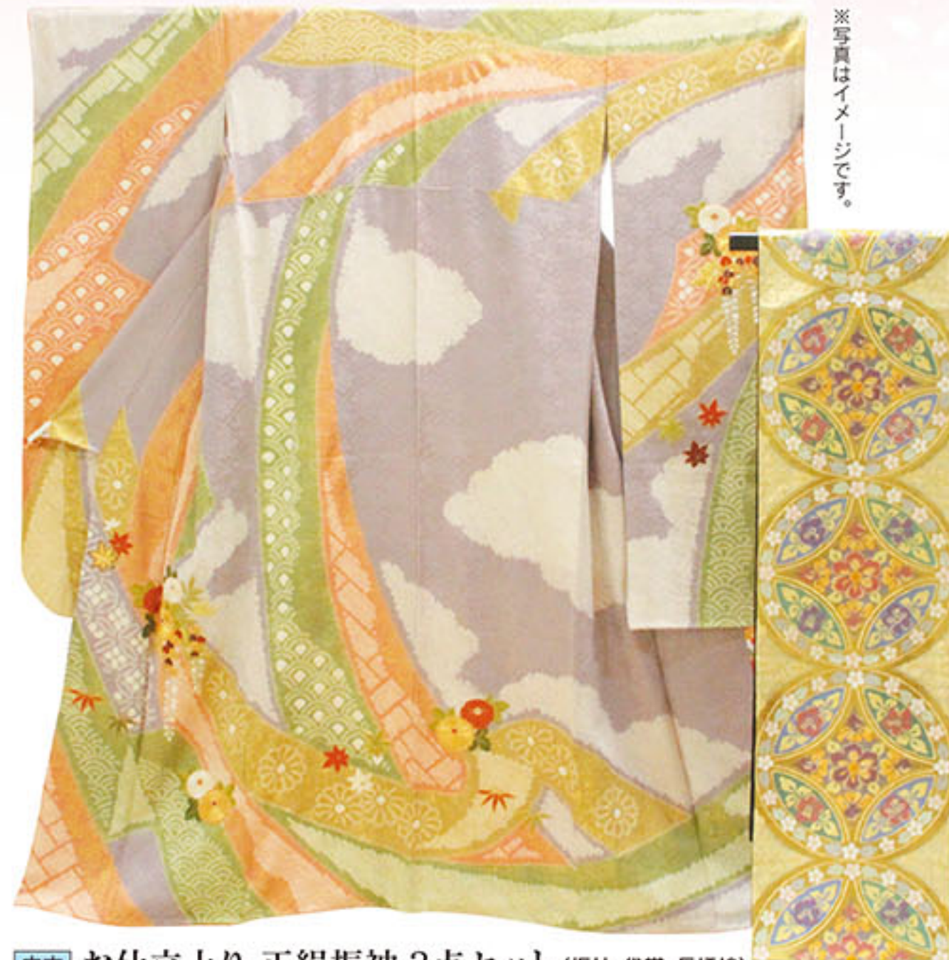
中古 お仕立上り 正絹振袖 3点セット (振袖・袋帯・長襦袢) 本体価格 150,000円 税込価格 162,000円