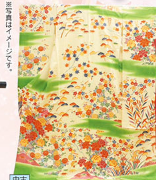
中古 お仕立上り 正絹振袖 (色ヤケ有り) 本体価格 10,000円 税込価格 10,800円