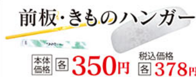
前板・きものハンガー 本体価格 各 350円 税込価格 各 378円