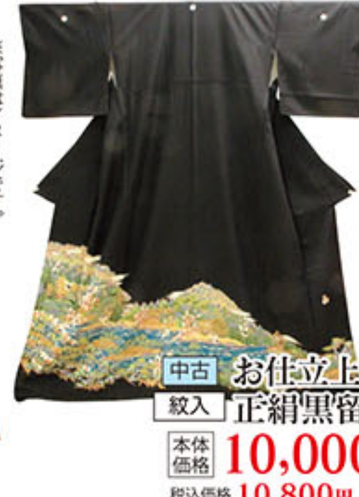
中古 紋入 お仕立上り 正絹黒留袖 本体価格 10,000円 税込価格 10,800円