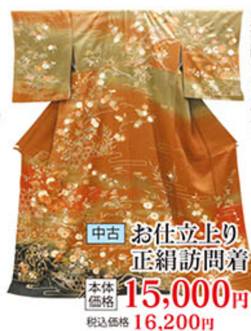
中古 お仕立上り 正絹訪問着 本体価格 15,000円 税込価格 16,200円