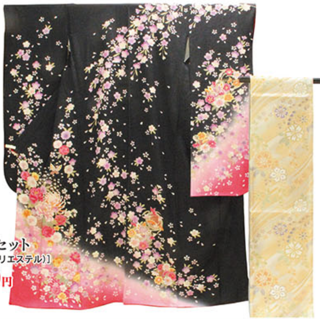
中古 お仕立上り 正絹振袖3点セット 【振袖・袋帯・長襦袢(ポリエステル)】 本体価格 50,000円 税込価格 54,000円