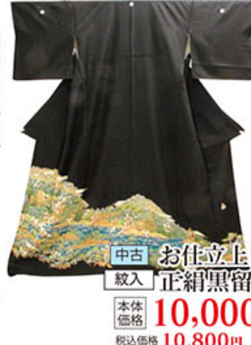
中古 お仕立上り 紋入 正絹黒留袖 本体価格 10,000円 税込価格 10,800円