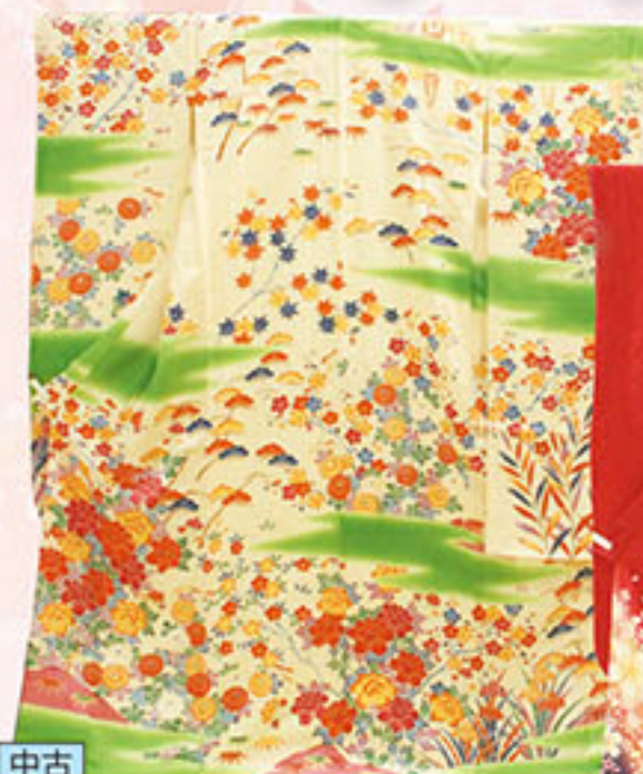
中古 お仕立上り 正絹振袖 (色ヤケ有り) 本体価格 10,000円 税込価格 10,800円