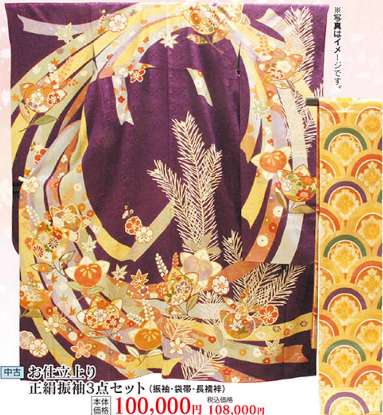
中古 お仕立上り 正絹振袖3点セット (振袖・袋帯・長襦袢) 本体価格 100,000円 税込価格 108,000円