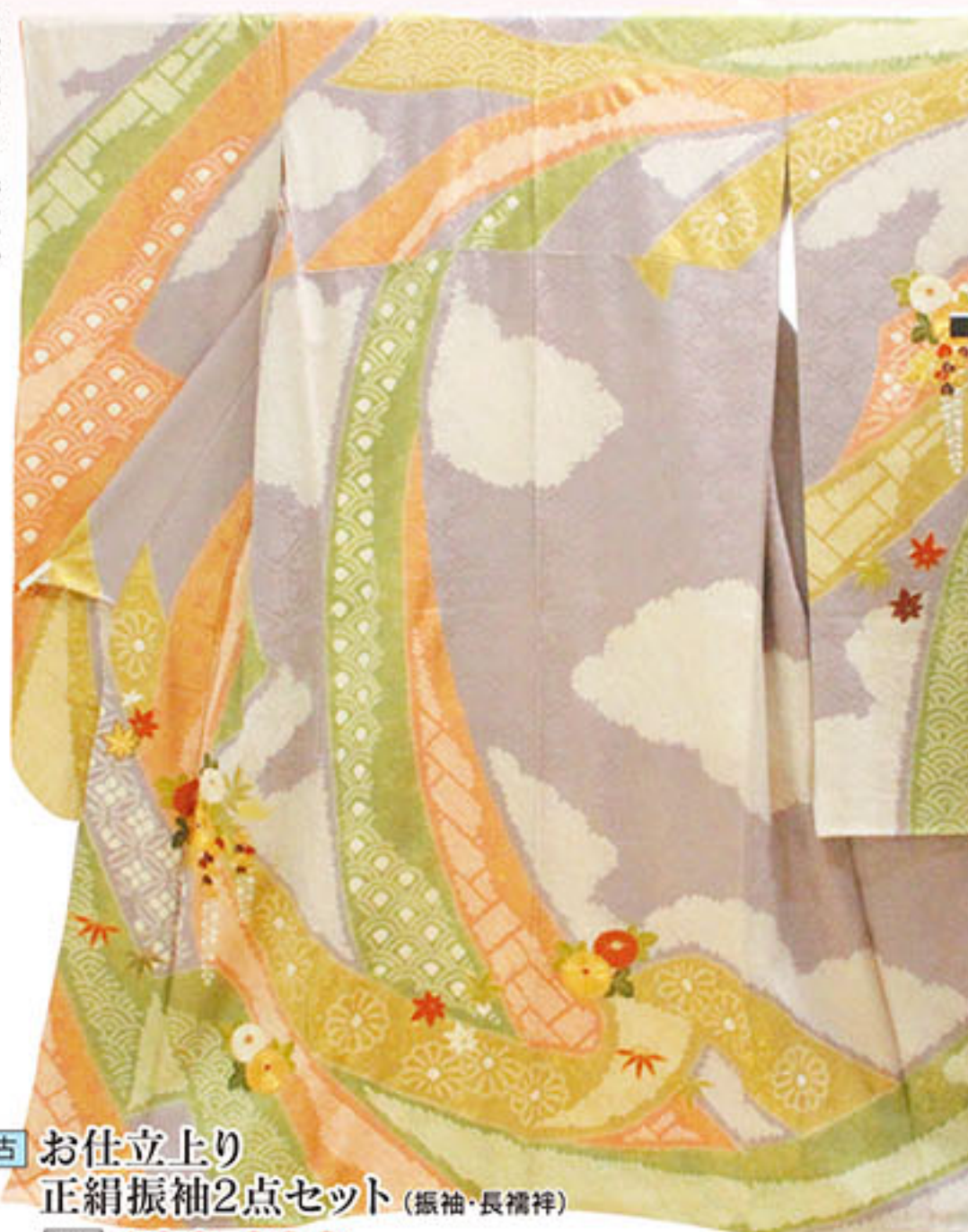
中古 お仕立上り 正絹振袖2点セット (振袖・長襦袢) 本体価格 100,000円 税込価格 108,000円