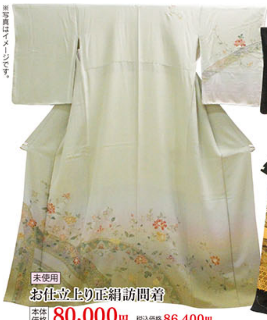
未使用 お仕立上り正絹訪問着 本体価格 80,000円 税込価格 86,400円