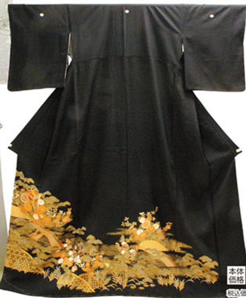
未使用 紋入 お仕立上り 正絹黒留袖 本体価格 29,000円 税込価格 31,320円