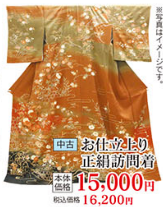
中古 お仕立上り 正絹訪問着 本体価格 15,000円 税込価格 16,200円