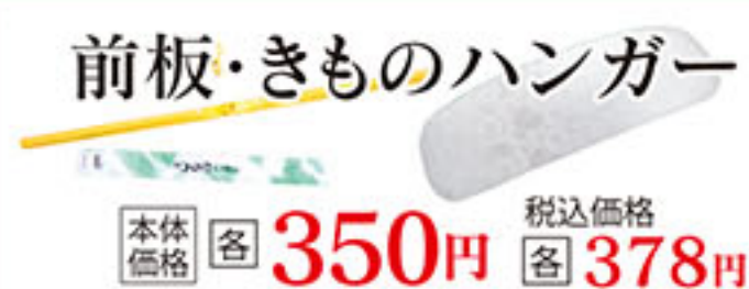
前板・きものハンガー 本体価格 各 350円 税込価格 各 378円