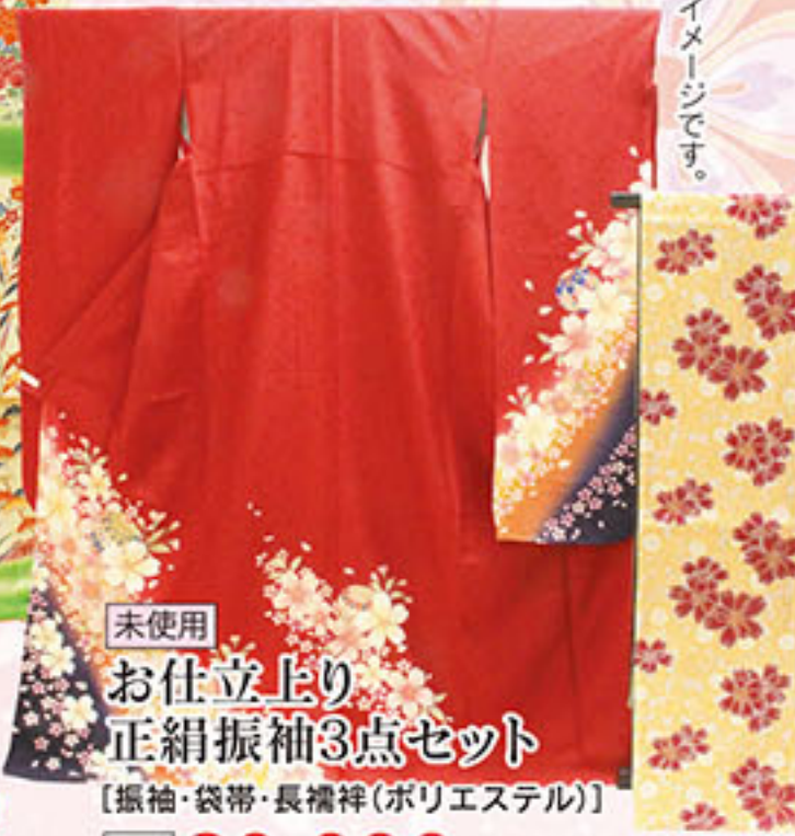
未使用 お仕立上り 正絹振袖3点セット 【振袖・袋帯・長襦袢(ポリエステル)】 本体価格 80,000円 税込価格 86,400円