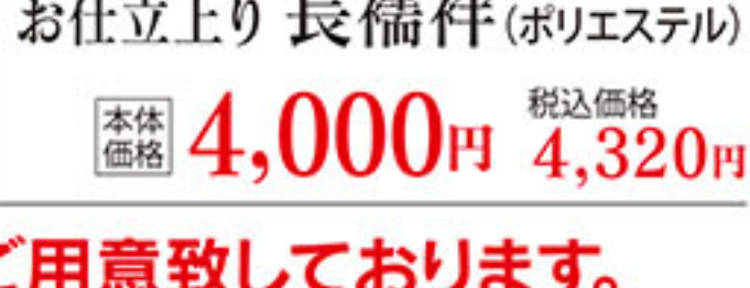
お仕立上り 長襦袢 (ポリエステル) 本体価格 4,000円 税込価格 4,320円