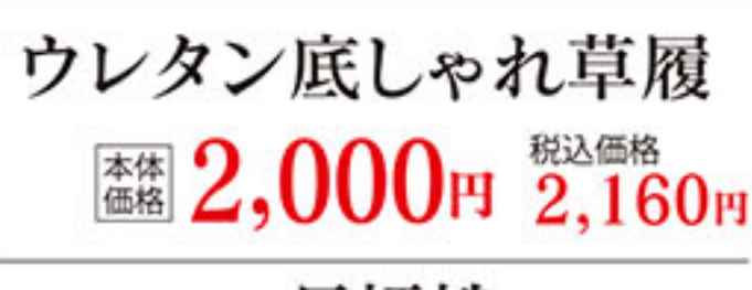
ウレタン底しゃれ草履 本体価格 2,000円 税込価格 2,160円