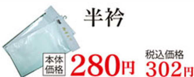
半衿 本体価格 280円 税込価格 302円