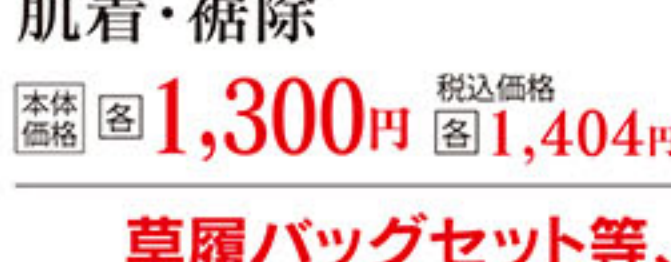
肌着・裾除 本体価格 各 1,300円 税込価格 各 1,404円