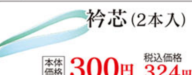
衿芯 (2本入) 本体価格 300円 税込価格 324円