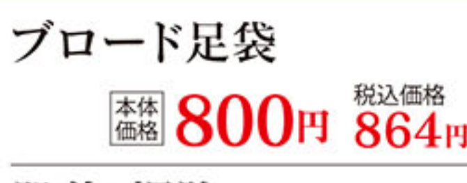
ブロード足袋 本体価格 800円 税込価格 864円