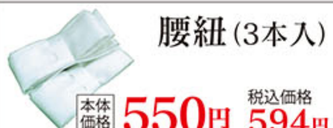
腰紐 (3本入) 本体価格 550円 税込価格 594円