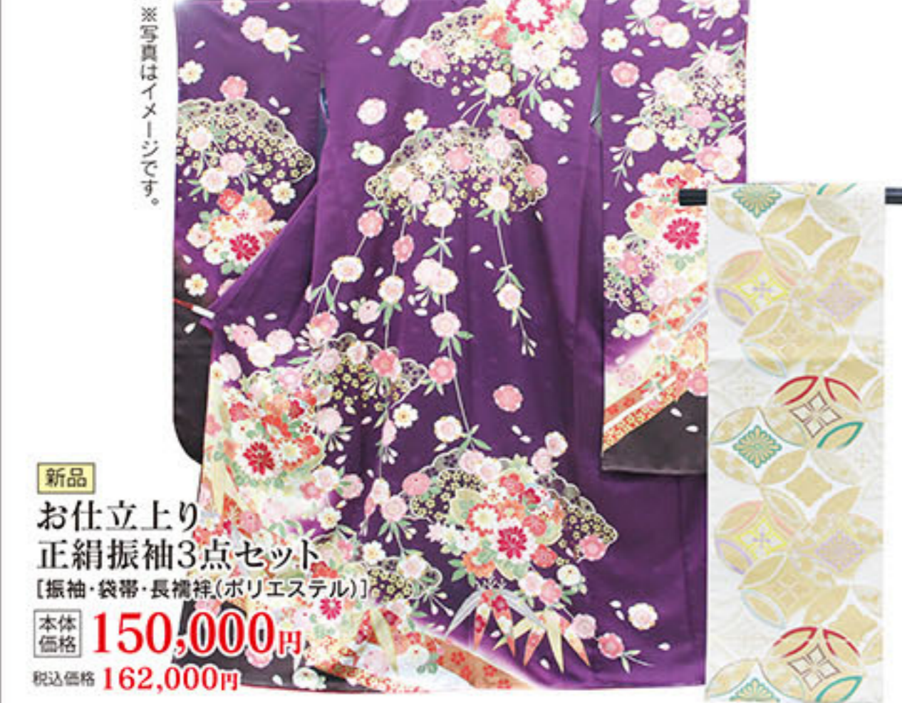
新品 お仕立上り 正絹振袖3点セット 【振袖・袋帯・長襦袢(ポリエステル)】 本体価格 150,000円 税込価格 162,000円