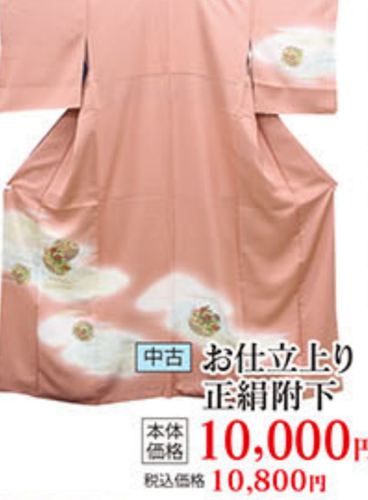
中古 お仕立上り 正絹附下 本体価格 10,000円 税込価格 10,800円