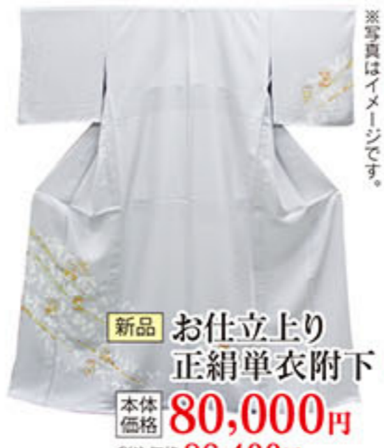
新品 お仕立上り 正絹単衣附下 本体価格 80,000円 税込価格 86,400円