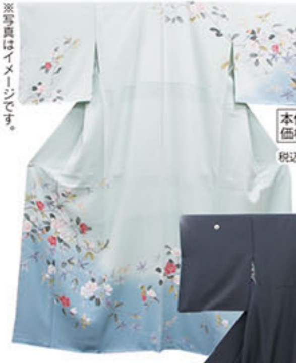
未使用 お仕立上り 正絹訪問着 本体価格 39,000円 税込価格 42,120円