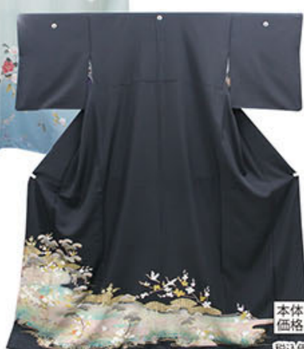
中古 紋入 お仕立上り 正絹黒留袖 本体価格 25,000円 税込価格 27,000円